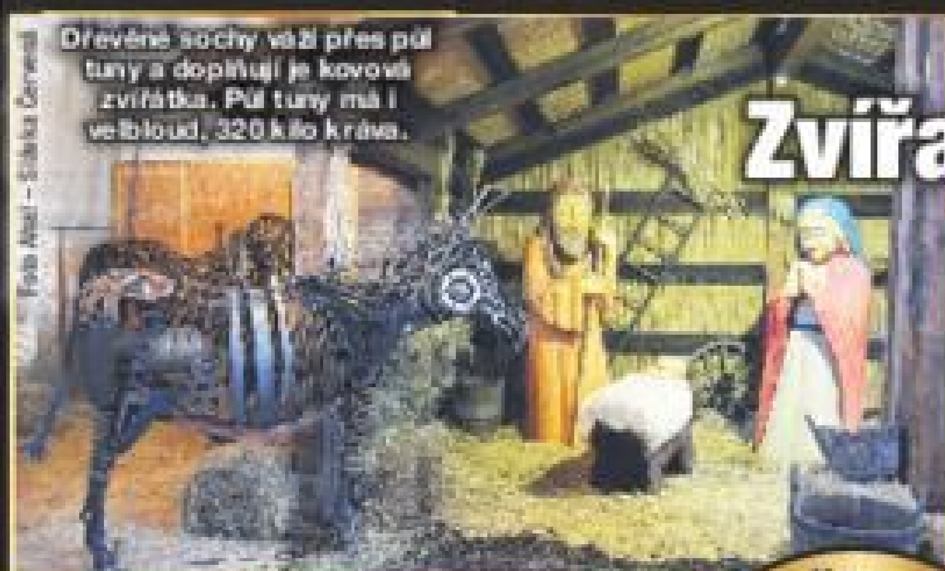
Dřevěné sochy vaří přes půl tuny a doplňují je kovová zvířátka. Půl tuny má i velbloud, 320 kilo kráva.

Na Prokešově náměstí v sobotu vyvrcholil kulturní program rozsvícením stromu.